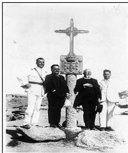
в Кабу-Негру (Ангола)

Рис. 1 – Падран, установленный Диогу Као