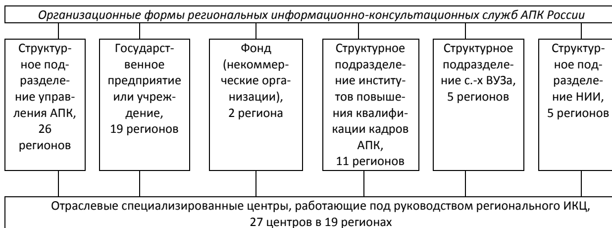
Рисунок 1. Организационные формы региональных ИКЦ

Службы такого типа, многие из которых существуют в рамках проекта АРИС, имеются в 26 регионах, в том числе в 125 районах.